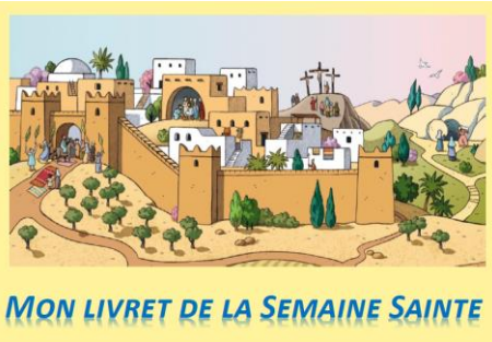
MON LIVRET DE LA SEMAINE SAINTE

Contact : communication-paysdelalys@arras.catholique.fr